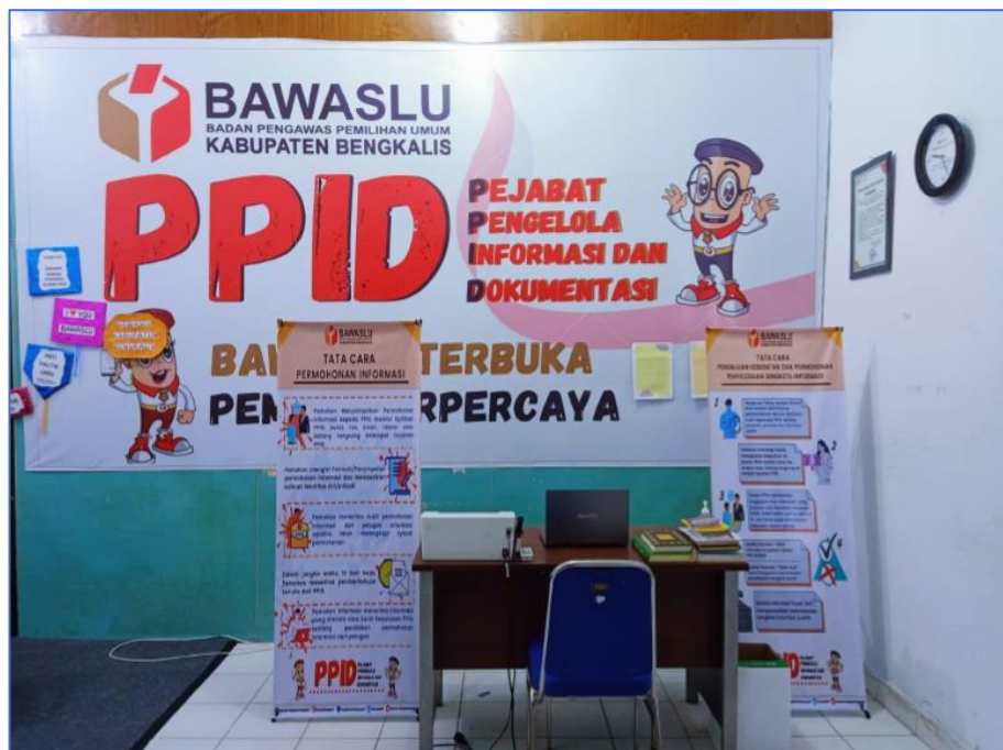
Gambar 3. Ruang Pelayan PPID Bawaslu Kabupaten Bengkalis dari Luar