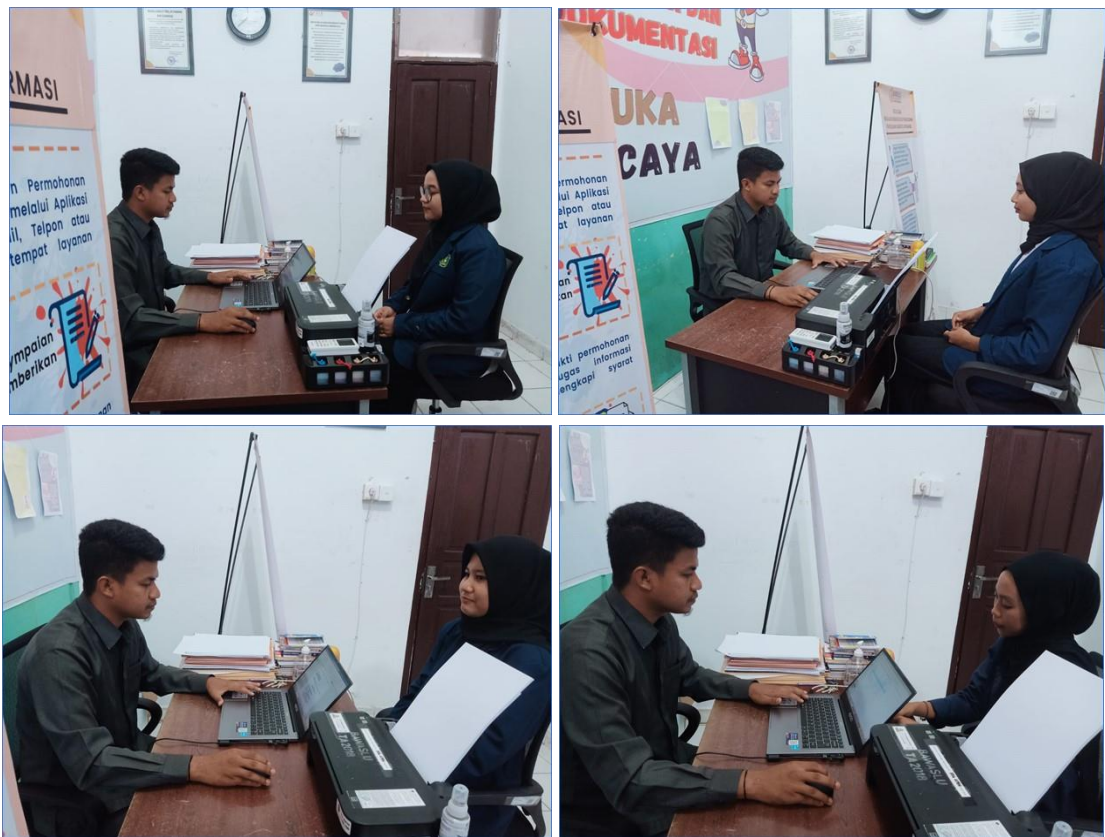
Gambar 5. Pemohon Informasi pada Tahun 2023 PPID Bawaslu Kabupaten Bengkalis

Informasi Publik yang dikabulkan oleh PPID Bawaslu kabupaten Bengkalis terhadap pemohon informasi sebanyak 7 (Tujuh) orang dengan rincian sebagai berikut: