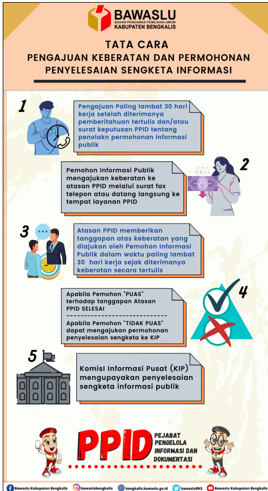
Gambar 4. Tata Cara pengajuan Keberatan dan Permohonan Penyelesaian Sengketa Informasi